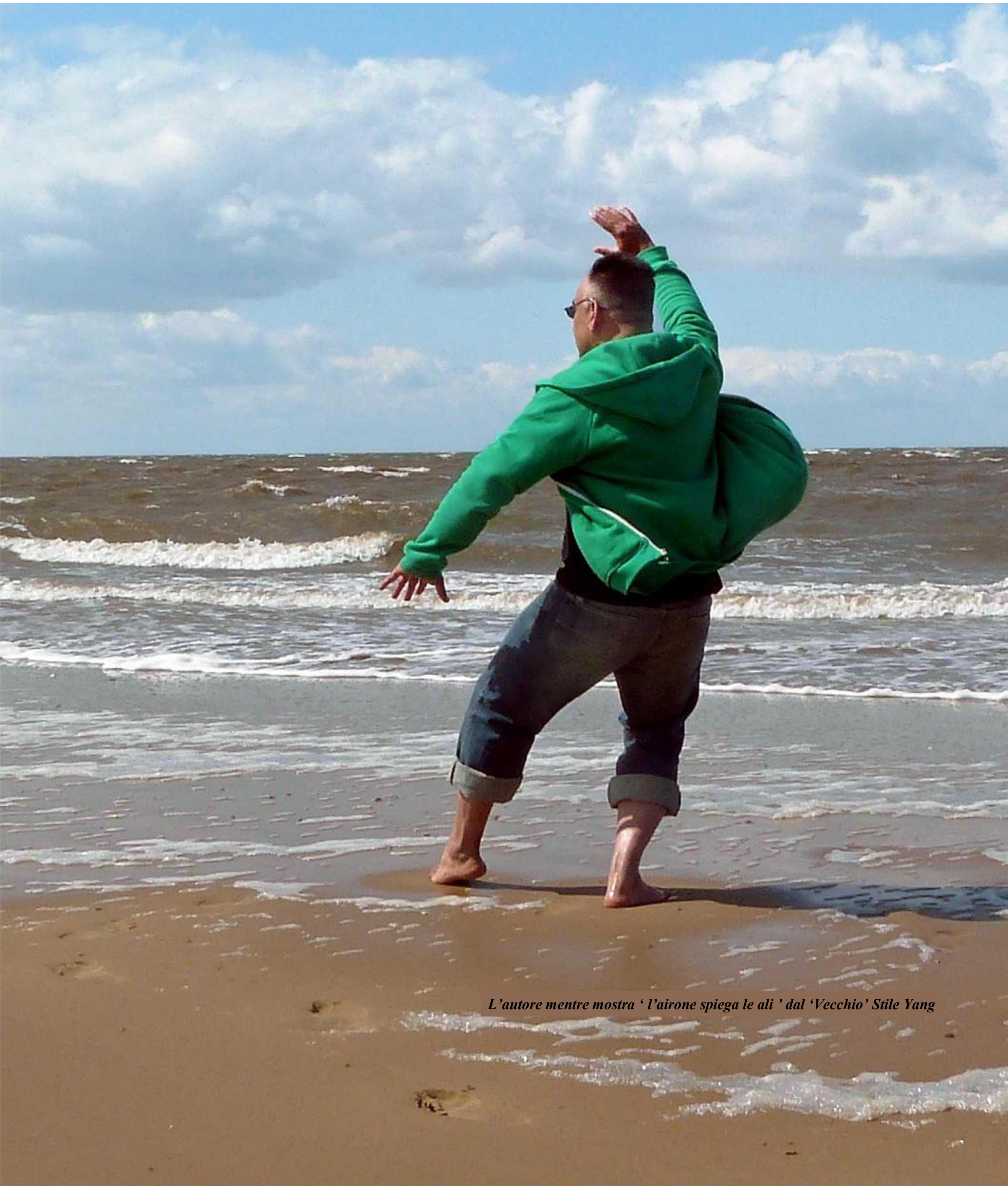
L'autore mentre mostra ' l'airone spiega le ali ' dal 'Vecchio' Stile Yang